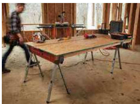
PM-4550T Speedhorse™XT アジャスタブルソーホーススタンド (2PC) ¥37,400 (税込 ¥41,140) ●材質: スチール ●入数: 2 ●使用時高: 76~91cm ●1本あたりの最大耐荷重 1,800 lbs. (816kg) ●レバーでワンタッチ設定 ●1インチ (約 2.5cm) 毎で脚の長さを変更可能