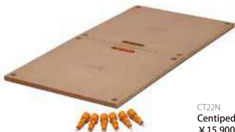
CT22N Centipede® プレーンテーブルトップ ¥15,900 (税込 ¥17,490) ●サイズ: 61×122cm 厚さ: 18mm (2'x4' サイズ) ●材質: MDF ●最大荷重: 2000 lbs. (907kg) ●固定用ツイストロック付属