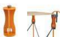
CA0506 Centipede® ライザーセット (6PC) ¥5,000 (税込 ¥5,500) ●入り数: 6 ●材質: 樹脂 ●6インチ (15cm) 作業位置を高くするライザー