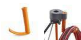
CA0402 Centipede® フックセット (2PC) ¥1,200 (税込 ¥1,320) ●入り数: 2 ●材質: 樹脂