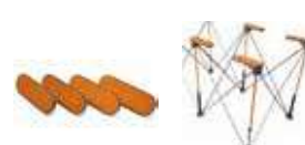
CA0804 Centipede® ワイドパネルサポート (4PC) ¥4,300 (税込 ¥4,730) ●入り数: 4 ●材質: 樹脂、ラバー ●ドッグホールに対応