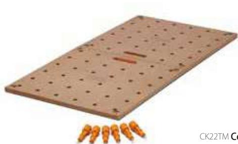
CK22TM Centipede® テーブルトップ 2'x4' ¥14,800 (税込 ¥16,280) ●サイズ: 61×122cm 厚さ: 18mm (2'x4' サイズ) ●材質: MDF ●最大荷重: 2000 lbs. (907kg) ●ドックホール径: 20mm ●ホール間隔: 芯々 96mm ●固定用ツイストロック付属