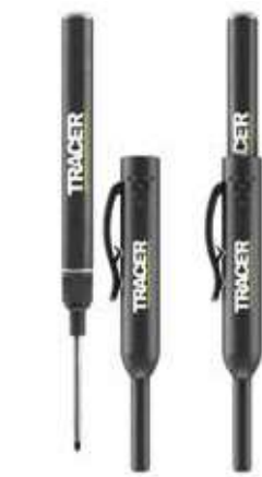
ALNP2 ディープホールマーカーペン (2本セット) ¥2,000 (税込¥2,200)