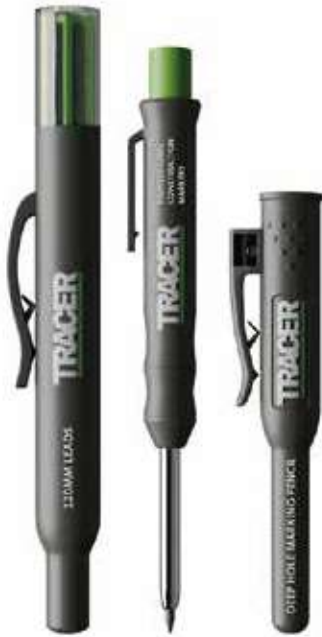
AMK1 ディープホールシャープペンシル 2.8mm+ 替芯セット ¥2,300 (税込¥2,530)