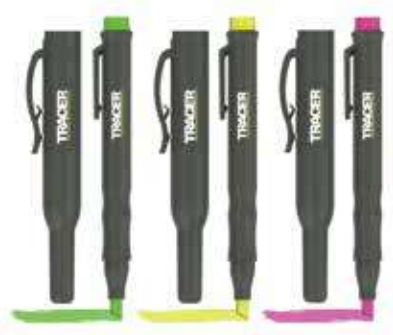
AFH-MK3-PF NEW コントラクション蛍光マーカー (3本セット) ¥2,300 (税込¥2,530)