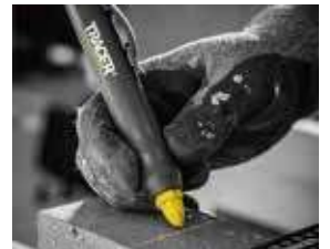
ACMH1 NEW ランバークレヨンホルダー (イエロークレヨン付き) ¥1,200 (税込¥1,320)