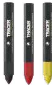
NEW ランバークレヨン 12本パック 各¥1,560 (税込¥1,716)