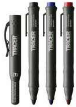
ACF-MK3 クロックフリーマーカー (3本セット) ¥2,600 (税込¥2,860)