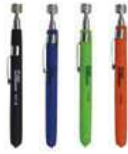
HT-5 HT-5BL HT-5GR HT-5OR